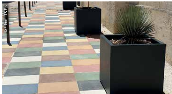
Cubiques et contemporaines, les jardinières Epure d'Edmond & Fils s'intègrent dans toutes les configurations urbaines. Elles se composent d'acier haute résistance.