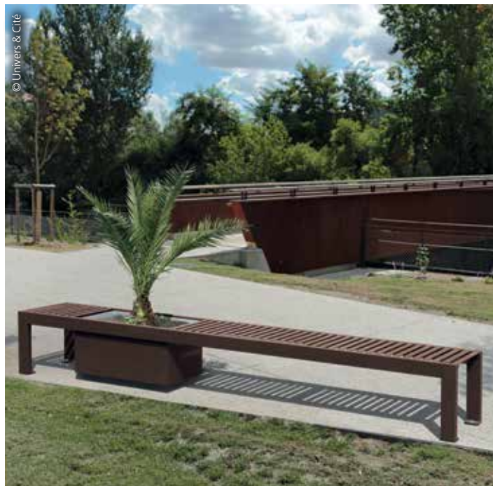
Voici la banquette-jardinière Synergie d'Univers&Cité. La force de l'acier est adoucie par le végétal.