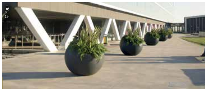
Le pot sphérique Maximo de Papi se distingue par sa partie supérieure inclinée, donnant à la végétation un caractère ‘abondant’.