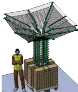
CityMur® Oasis 9m 2