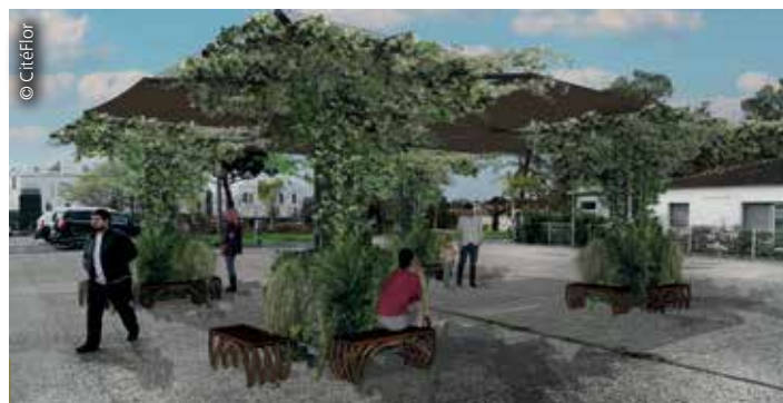
La dernière innovation CitéFlor est le CityMur® Oasis, structure 'végétale' déplaçable et modulable. Des toiles d'ombrage et des brumisateurs peuvent être associées.