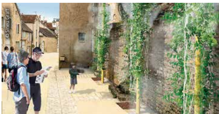
Volubilis de Sineu Graff se compose d'un tuteur destiné aux plantes grimpantes. Il comprend un mât en acier scellé dans une fondation en béton, parsemé de disques métalliques sur lesquels sont tendus des câbles. Il peut être couplé à un brumisateurs implanté au sommet.