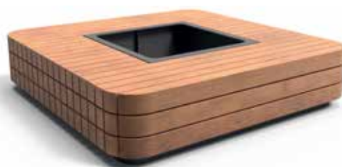
Fixée sur une fondation en béton, la banquette carrée Modulo Green de Croso France combine acier galvanisé à chaud et bois (exotique ou néerlandais).