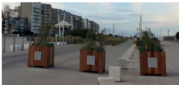
La jardinière anti-intrusion (JA108) Buton Design végétalise et sécurise l'espace public. Elle est composée d'un bloc de béton de 950 kg et d'un contenant de 150 L. D'autres dimensions existent dans le catalogue.