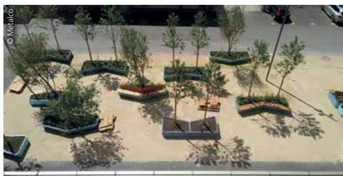
Les mobiliers City of Sion, proposés par Metalco, sont disponibles en diverses configurations (forme concave, convexe, avec ou sans dossier...).