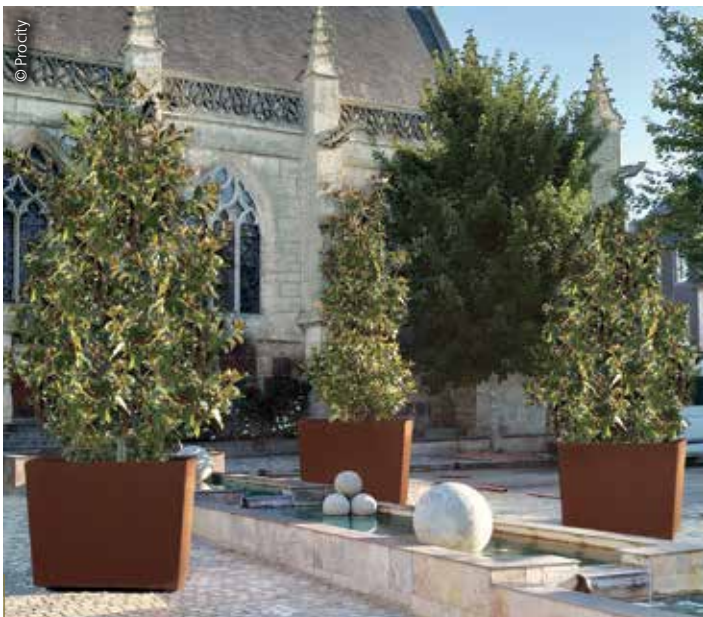
Fabriqué en acier galvanisé, le bac à palmiers Olbia de Procity® dispose d'un bac amovible avec anneaux permettant d'installer et d'entretenir aisément la végétation. Ce modèle est disponible en trois dimensions selon les besoins d'implantation.