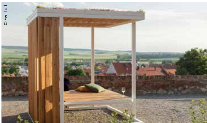
Proposés par Evo Lud, les abris Cuby ont la possibilité d'être recouverts par un toit végétalisé. Diverses parois sont disponibles : lames en bois persiennes, treillis pour plantes grimpantes, verre de sécurité...