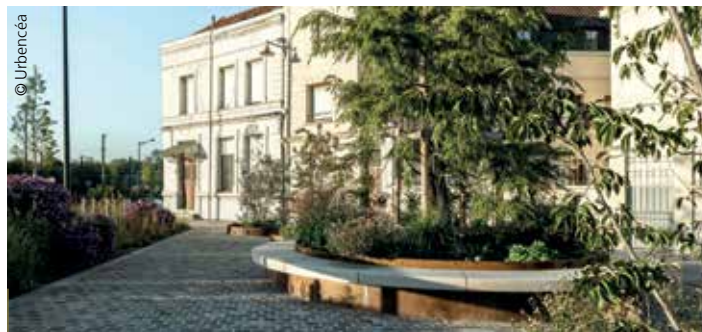
En acier thermolaqué ou Corten, l’îlot ‘vert’ Illa d’Urbencéa possède un diamètre maximal de 4,3 m. Les assises sont en béton ou en pierre.