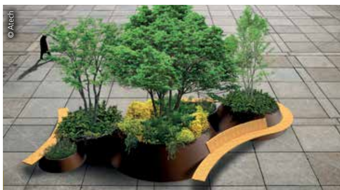
Avec ou sans fond, le ‘Jardin Olympe’ d’Atech crée des îlots de fraîcheur XXL. L’assise est en bois et les contenants en acier peint de 2 mm d’épaisseur.