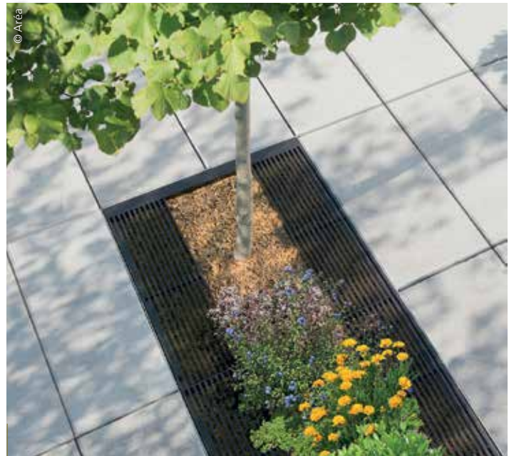
Les grilles d'arbres Cambridge d'Aréa, simples ou en alignements, permettent aux pieds d'arbres d'être végétalisés.

contenant de 150 L. Discret et sécurisé, ce bac à fleurs est aisément déplaçable. Habillée de compact HPL facile d'entretien, cette jardinière peut s'équiper également d'assises, corbeilles et appui-vélos. Un tout en un que les collectivités apprécient pour la protection et la modernisation des places de marché, rues commerçantes...", détaille Sophie Buton, du service marketing de l'entreprise.