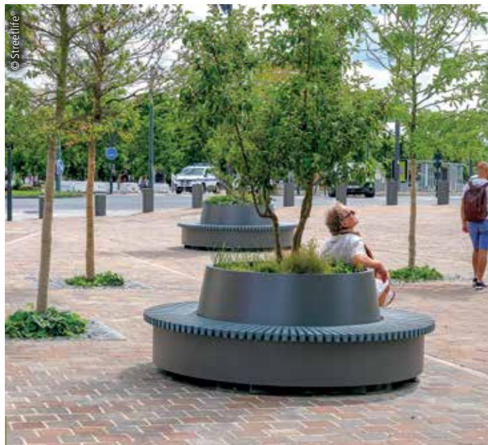
En acier galvanisé, la jardinière Imagine d'Accenturba se caractérise par une forme rectangulaire ou ronde (diamètre : 1,48 cm). La construction est soudée monobloc.